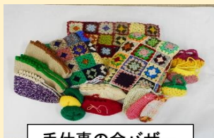
手仕事の会バザー