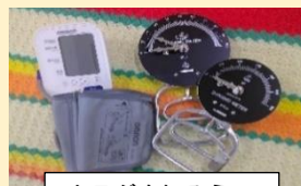
カラダを知ろう (握力・血圧測定)