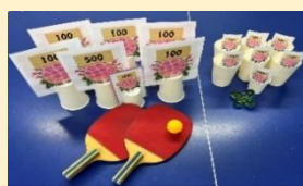
卓球・ビー玉的当てゲーム