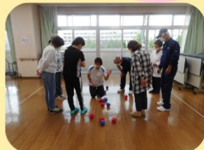
はじめてのポッチャ